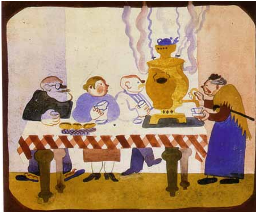
Vera Ermolaïeva, Illustration de pour livre de Daniil HARMS, Ivan Ivanovitch Le Samovar, (1930)

Au milieu des sons profonds, mélodieux ou parfois acides de la contrebasse nous faisons également appel, par petites touches, à la musicalité de la langue russe.